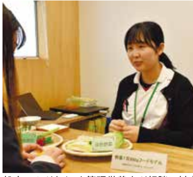
処方せんがなくても管理栄養士が相談に対応

薬局は、医療機関を受診した後、お薬をもらう場所、というイメージがあると思います。しかし、私たち溝上薬局では「病気になるから行く場所」ではなく、「病気になる前に相談しに行く場所」になることを目指しています。溝上薬局には管理栄養士が9名在籍しており、県内では5店舗で栄養相談を行っています。「なぜ薬局に管理栄養士？」と驚かれることもあります。薬の説明や治療だけでなく、食事や運動を含めたアドバイスを行い、地域の皆さんがいつでも健康に過ごすことができるようお手伝いすることが私たち薬局の使命です。